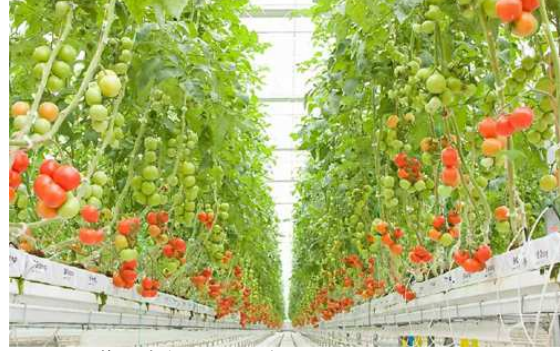
菜園内部イメージ